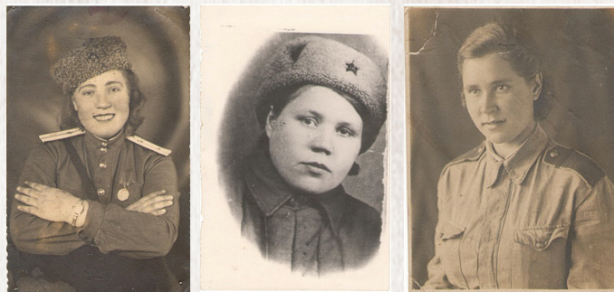
▲ почетные доноры СССР. Сдали за годы войны по 13 л. крови