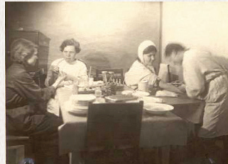
▲ Обследование доноров крови перед кроводачей.

важна и нужна. Многие доноры давали кровь до 40 раз и более. Донор своей кровью защищал от врага свою Родину».