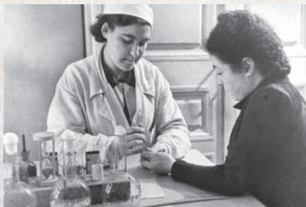
▲ Общий анализ крови