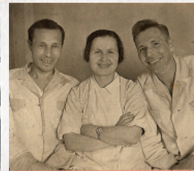
▲ Командиры Советской Армии возвращенные к жизни после тяжелых ранений

возможным благодаря расширению сети пунктов переливания крови с 3 в 1941 году до 7 в 1942 году.