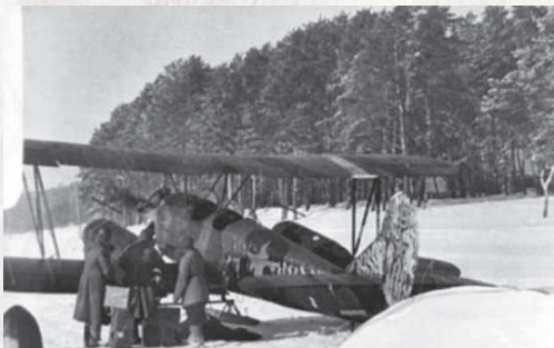
▲ Экстренная доставка крови в госпиталя