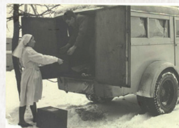
▲ Отправка крови в госпиталь для раненых

В связи с приближением линии фронта, по согласованию с Санитарным управлением Карельского фронта, станция вновь была свернута, погружена в вагоны и на платформы и переведена в Беломорск. Там