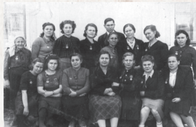
▲ Группа доноров, награжденная значками

году –816%. Заготовка крови в 1942 году увеличилась по сравнению с 1941 годом в 8 раз, в 1943 году –в 45 раз, в 1944 году – в 80 раз. Такой рост заготовки крови стал