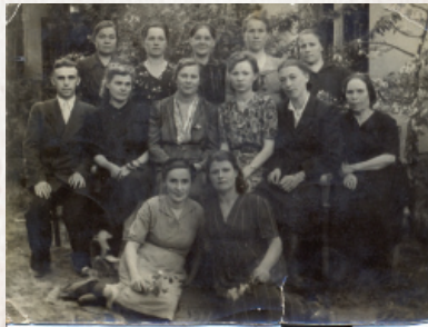
▲ Первый коллектив станции переливания крови

В республике было развернуто 14 эвакогоспиталей глубокого тыла, в том числе 10 эвакогоспиталей по линии БурНаркомздрава на 3700 коек и 4 эвакогоспиталей по линии обороны. При эвакогоспиталях было развернуто 7 пунктов переливания крови. Донорами, в основном, были сотрудники эвакогоспиталей. Организацией