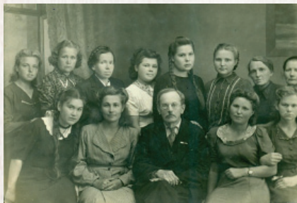
▲ Сотрудники Вологодской областной станции переливания крови, работавшие в годы Великой Отечественной войны

В этот ответственный период заявки от Действующей армии на консервированную кровь значительно увеличились. Между тем, Вологда могла со своим 100 тысячным населением давать фронту ежесуточно только 30 литров крови при плане 50. Назрела острая необходимость оперативного формирования филиалов Вологодской станции переливания крови в других близлежащих городах области. Такие филиалы были организованы в 2-х крупных госпитальных узлах: Череповце и Соколе. В годы войны доноры Череповца сдали на нужды госпиталей 10 тонн крови. Это позволило медикам ежесуточно получать еще 15 литров донорской крови. Недостающие до плана 5 литров восполнили доноры из числа эвакуированных ленинградцев.