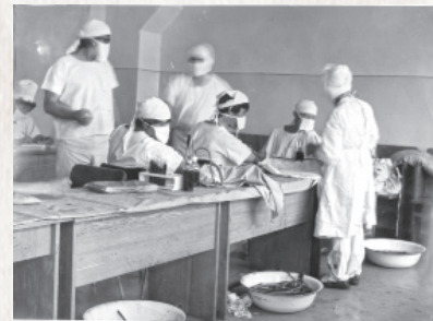
▲ Заготовка крови в выездных условиях