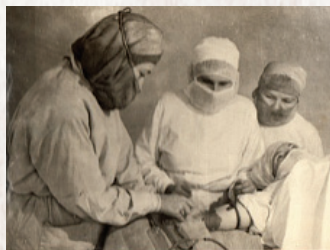
▲ Взятие крови

В годы Великой Отечественной войны пункты переливания крови были созданы в Вурнарской, Козловской, Мар-Посадской больницах, число доноров возросло до 3058 человек. С первых дней Великой Отечественной войны перед Чувашской станцией переливания крови была поставлена труднейшая задача резкого увеличения заготовки крови для снабжения тыловых госпиталей. В годы войны укрепилась совместная работа органов здравоохранения с обществом Красного креста. Срочно комплектуются донорские кадры, разворачивается массовое патриотическое движение населения по вступлению в ряды доноров, число которых возросло в нашей республике к концу 1941 года в 12 раз. Перед началом войны число не превышало 150 человек. В 1942 году рост числа доноров составил 182 % к довоенному времени, в 1943