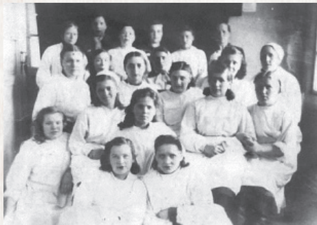
▲ Группа сотрудников АОСПК