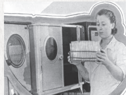
▲ Стерилизация пробирок