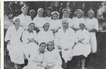
▲ Они начинали службу крови в Карело-Финской ССР

награжден Почетной грамотой Президиума Верховного Совета КФССР.