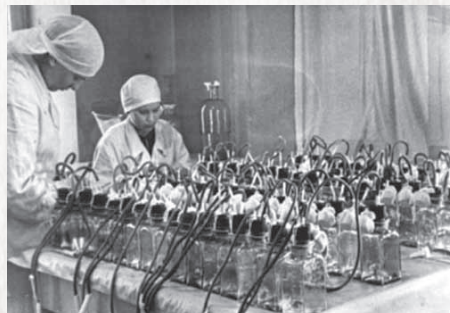
▲ Подготовка систем для забора крови