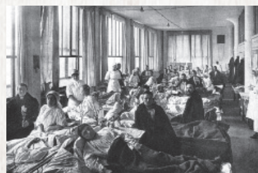
▲ Военный госпиталь в здании Томского университета.