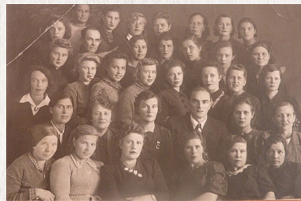
▲ Коллектив Кировской станции переливания крови, 1943 г.