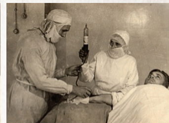
▲ Переливание крови

году –816%. Заготовка крови в 1942 году увеличилась по сравнению с 1941 годом в 8 раз, в 1943 году –в 45 раз, в 1944 году – в 80 раз. Такой рост заготовки крови стал