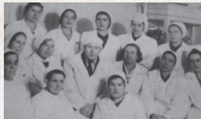
▲ Коллектив Томской станции переливания крови, 40-е гг.